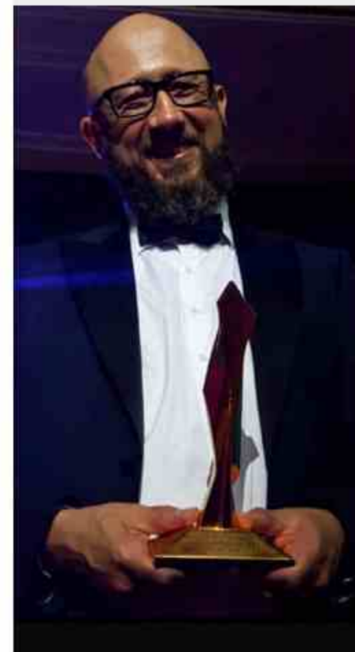
Золотая статуэтка — «Оскар» в сфере недвижимости. Главный приз международной премии FIABCI World Prix d'Excellence Awards

Популярность направления Редевелопмента и проектов в стиле лофт способствовала увеличению стоимости объектов недвижимости и максимизации доходов от сдачи в аренду лофт-офисов и продаж лофт-апартаментов.