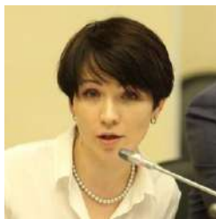
Олеся Лещенко, директор Департамента развития жилищно-коммунального хозяйства Минстроя России