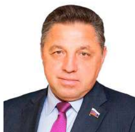
Вячеслав Тимченко* Совет Федерации