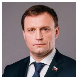
Сергей Пахомов* Государственная Дума