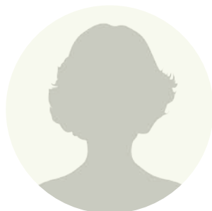
Ирина Хованская ГУ МВД по г. Москве