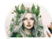
Telegram-канал "Зеленая барыня ESG"