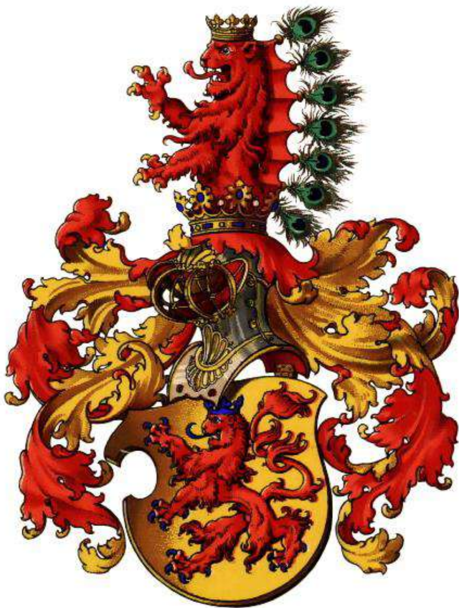
Родовой герб Габсбургов