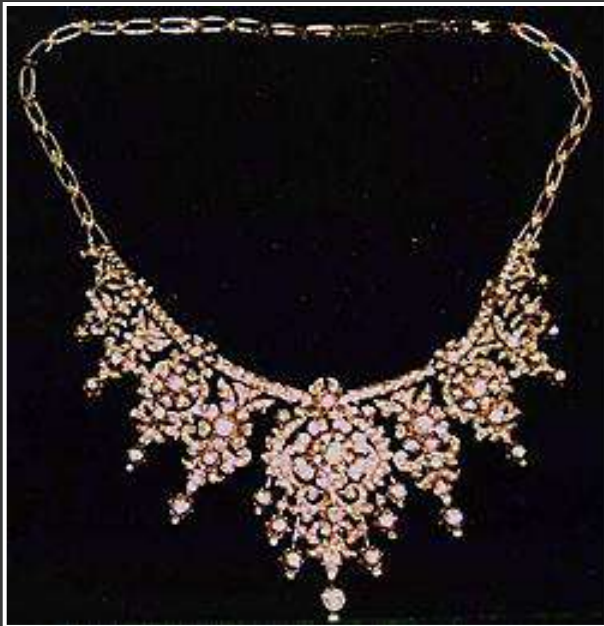
Фото 1. Колье-трансформер в стандартном положении.